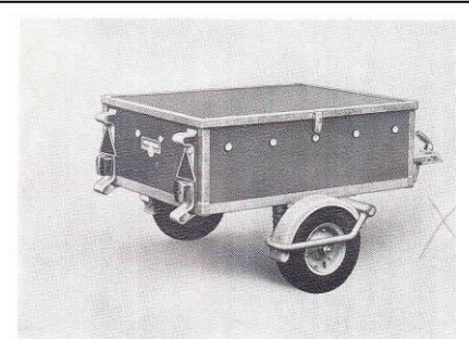
Mit verschließbarem Deckel